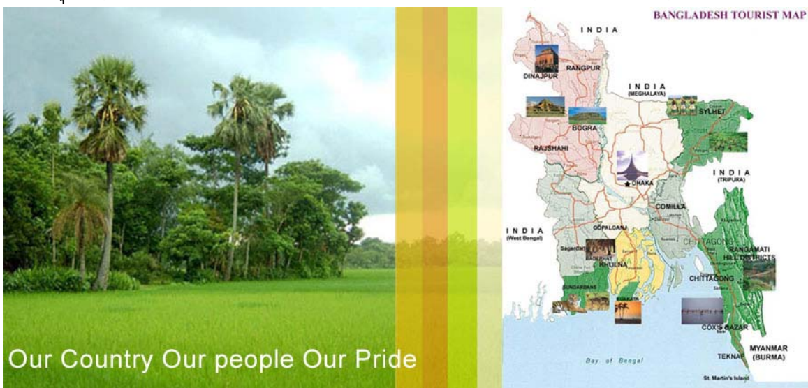
ภาพแสดงแผนที่ของบังกลาเทศ