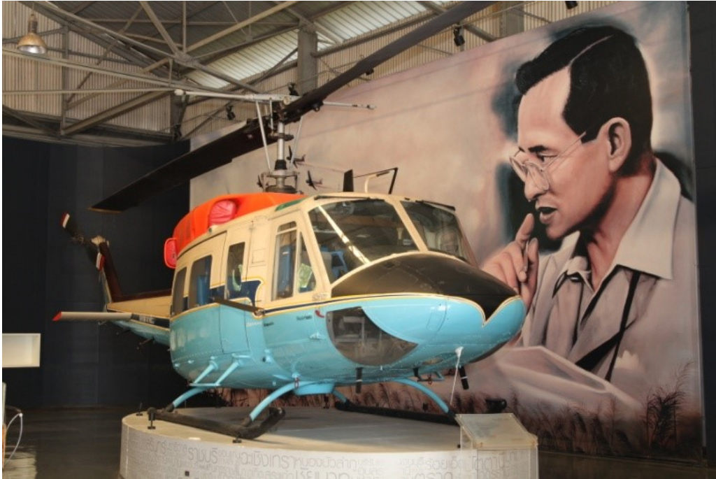
เฮลิคอปเตอร์ ฮ.๖ ก (UH-1N) หรือ ฮ.สีฟ้า เฮลิคอปเตอร์พระที่นั่งของพระบาทสมเด็จพระเจ้าอยู่หัว รัชกาลที่ ๙ ปัจจุบันจัดแสดงอยู่ที่ พิพิธภัณฑ์กองทัพอากาศและการบินแห่งชาติ ( www.raf.mi.th/th/Pages/tourist_Attractions.aspx )