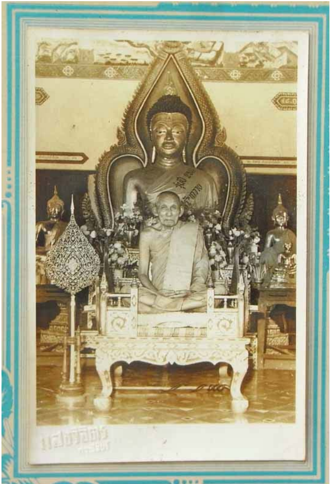
พระราชพรหมจริยคุณ วัดศรีบุญเรือง เจ้าคณะจังหวัดกาฬสินธุ์