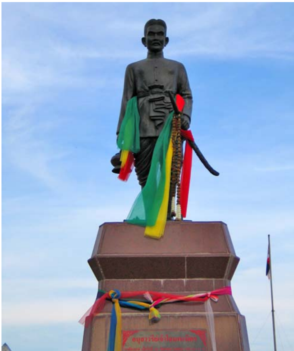
พระยาชัยสุนทร (ท้าวโสมพะมิตร) เจ้าเมืองกาฬสินธุ์องค์แรก (พ.ศ. ๒๕๓๖)